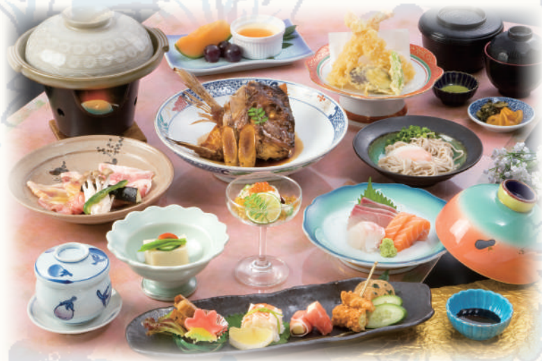
会席料理のイメージ

長崎荘では、ご法要にふさわしい静かな雰囲気と、季節の旬を添えた自慢の料理で、心を込めたおもてなしのお手伝いをいたします。